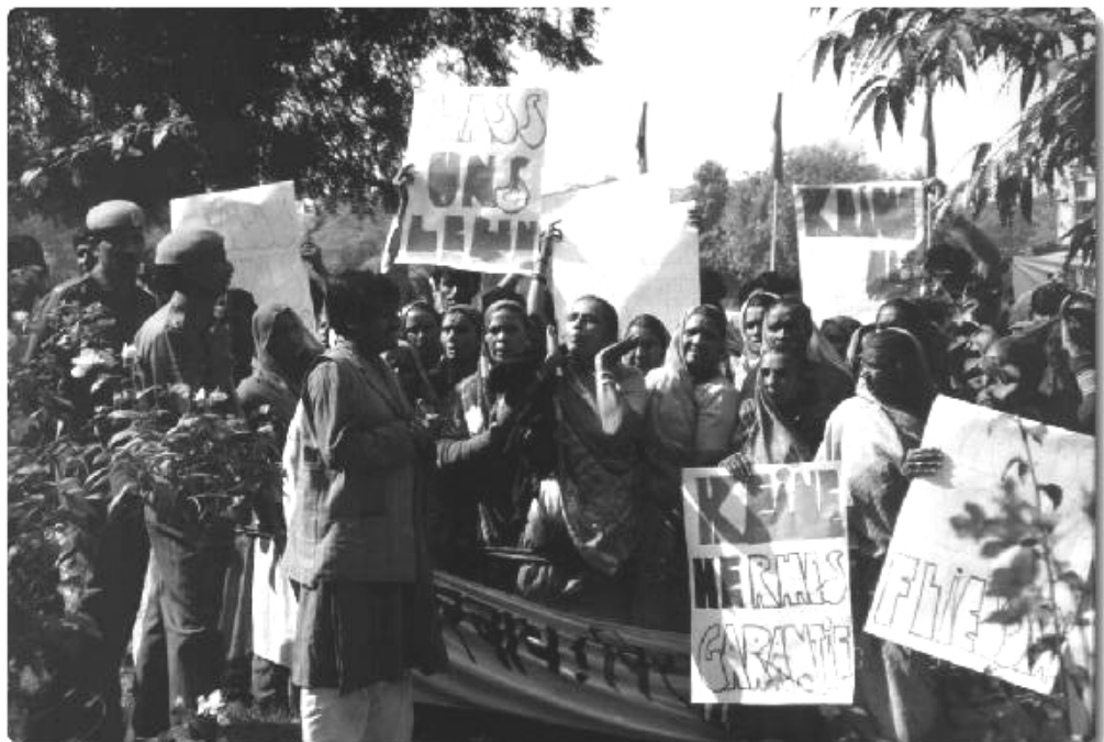
Demo vor der deutschen Botschaft

dig auf die asiatische hinzubewegt, wird dieser Staudamm auch noch in einem stark erdbebengefährdetem Gebiet gebaut, wenn ein sol-